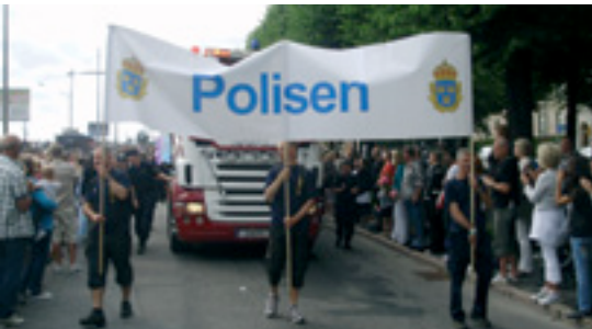
Policijski/e službenici/e švedske policije u Povorci ponosa 2010